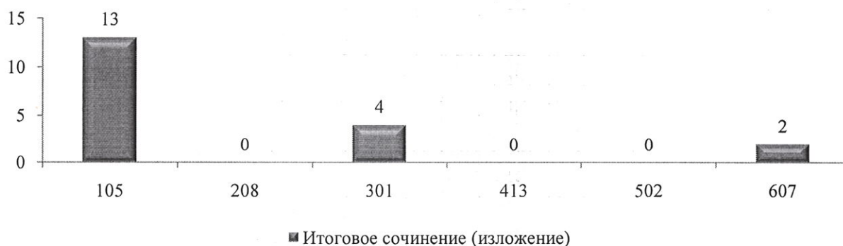
Выбор тем итогового сочинения выпускниками 11-го класса

Из диаграммы видно, что 13 (68,42%) обучающихся выбрали тему № 105. Тему № 301 – 4 (21,05%) обучающихся. Тему № 607 – 2 (10,53%) обучающихся. Темы № 208, 413, 502 — обучающиеся не выбрали.